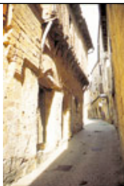
La Grande Rue